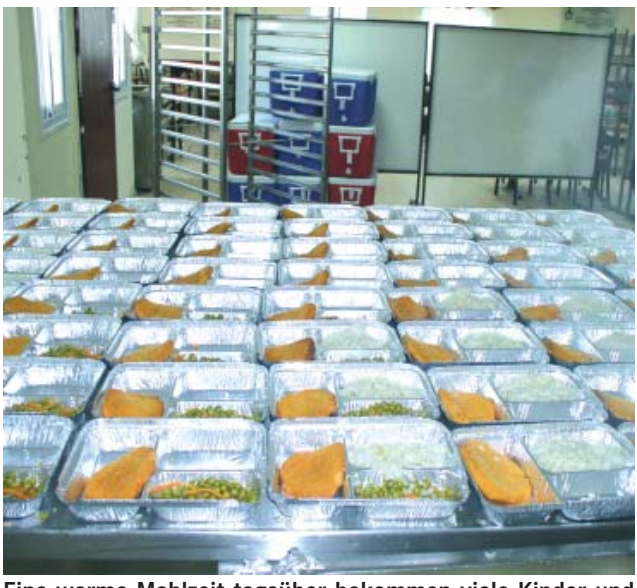
Eine warme Mahlzeit tagsüber bekommen viele Kinder und Jugendliche eher selten. Der Grund: Den Eltern fehlt oftmals das Geld, damit ihre Kinder an der Schulspeisung teilnehmen können. Die ökumenische Initiative „Unser täglich Brot“ im Hachinger Tal geht diese Problematik jetzt an.